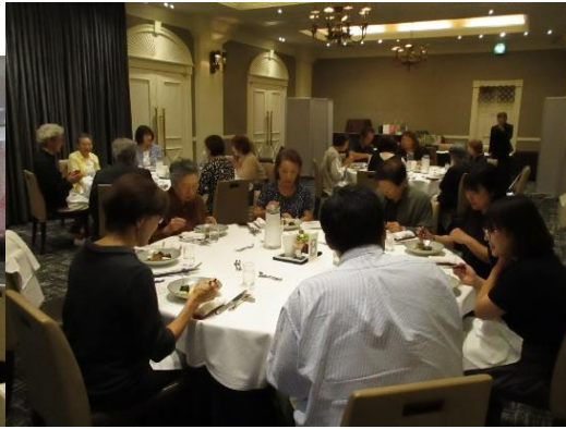
駿河湾レシピを頂きながら…