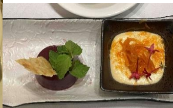
《デザート・飲み物》