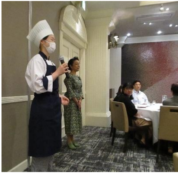
メニュー担当者の解説