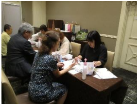
↑食前後の血糖測定